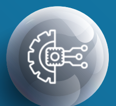
Kontrol ve Otomasyon